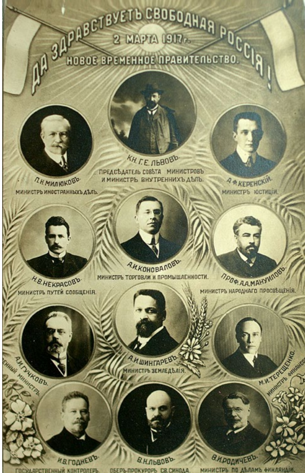
Временное правительство в том составе, который был учрежден в первые дни революции, просуществовало до 5 мая 1917 года

Само собой разумеется, как это и сказано в сообщаемом документе, Временное правительство, ограждая права нашей родины, будет вполне соблюдать обязательства, принятые в отношении наших союзников. Продолжая питать полную уверенность в победоносном окончании настоящей войны, в полном согласии с союзниками, оно совершенно уверено и в том, что поднятые этой войной вопросы будут разрешены в духе создания прочной основы для длительного мира и что проникнутые одинаковыми стремлениями передовые демократии найдут способ добиться тех гарантий и санкций, которые необходимы для предупреждения новых кровавых столкновений в будущем».