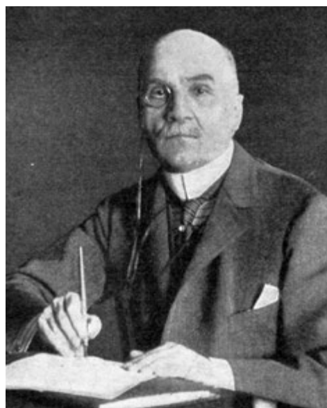
Морис Палеолог – посол Франции в России с 1914 по 1917 год

Миллюков сразу же, как только занял этот пост, попал под давление союзников. Уже 5 (18) марта, когда