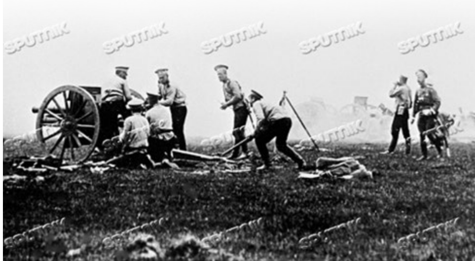
Русские артиллеристы заряжают пушку во время боя с германскими войсками. Первая мировая война

Дополнительной уверенности Милюкову придал состоявшийся в конце марта VII съезд Конституционно-демократической (кадетской) партии. Съезд провозгласил Временное правительство «единственной исполнительной и законодательной властью страны», отведя Советам роль совещательного органа. Кадеты дружно высказались за продолжение войны до победы, завершить которую без приобретений не хотели. Настроение съезда выразил Федор Родичев, прямо заявивший: «Нам нужны проливы».