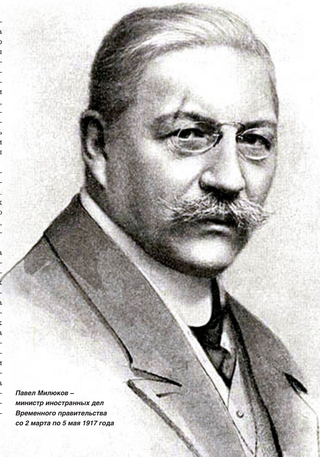
Павел Милюков – министр иностранных дел Временного правительства со 2 марта по 5 мая 1917 года

И все из-за того, что в апреле 1917 года министр иностранных дел Милюков направил правительствам держав Антанты ноту, в которой заверял западных партнеров, что Россия будет вести войну вплоть до победного конца. Когда об этой ноте узнали рабочие и солдаты Петроградского гарнизона, они, как в дни Февральской революции, снова вышли на улицы, теперь уже требуя отставки Милюкова. Впервые столкнувшись со столь широким проявлением народного недовольства, министр-председатель Временного правительства князь Георгий Львов и все члены его кабинета сразу же ощутили, насколько непрочна их власть и как сильны в обществе антивоенные настроения.