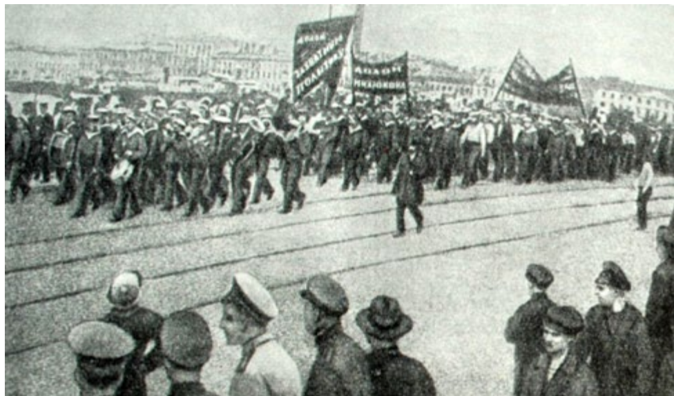
Демонстрация протеста в Петрограде. Люди несут плакаты «Долой захватную политику!», «Долой Миллюкова!». Апрель 1917 года

Однако с формулой мира «без аннексий и контрибуций» был категорически не согласен Павел Миллюков. Близкий к нему кадет Владимир Набоков писал: «Миллюков и в прессе, и с трибуны Государственной Думы