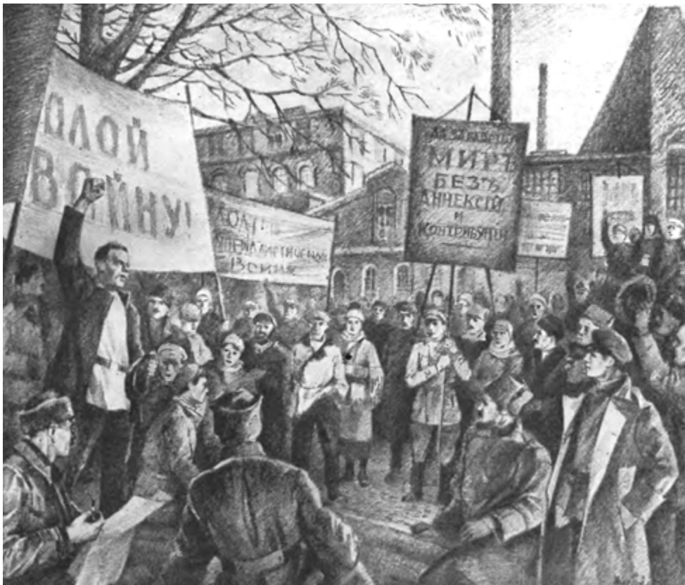
Апрельские дни в Петрограде. Рабочая демонстрация. 1917 год. Рис. Н. Павлова

правительства, так и против. Были и столкновения, и жертвы.