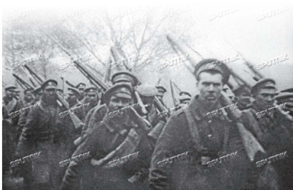
В 1917 году одним из наиболее острых был вопрос о войне, тянувшейся уже более двух с половиной лет

Казалось бы, тем самым Временное правительство отказывалось от мечты шовинистов (включая министра Милюкова) водрузить русский флаг над Дарданеллами. Впрочем, при этом в текст по настоянию кадета Федора Коккошкина попали также слова о соблюдении обязательств перед союзниками. Это поставило согласование заявления с социалистами на грань срыва, ведь сами обязательства содер-