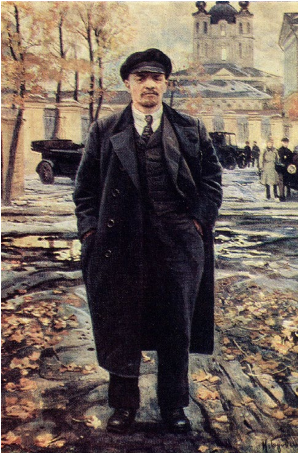
В.И. Ленин на фоне Смольного. Худ. И.И. Бродский. 1925