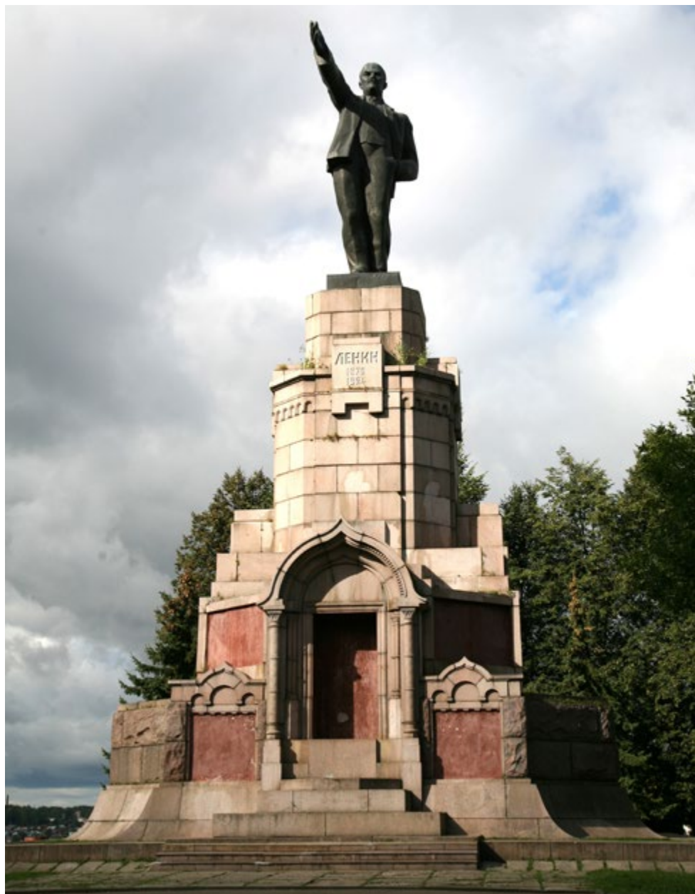
Памятник В.И. Ленину в Костроме. Скульптура Ленина была установлена на постаменте, предназначавшемся для памятника в честь 300-летия дома Романовых

Ленин был подлинным вождем своей партии. «Если когда-то французский король Людовик XIV мог говорить: государство – это я, то Ленин без излишних слов неизменно чувствовал, что партия – это он, что он – концентрированная в одном человеке воля движения. И соответственно этому действовал», – констатировал Потресов.