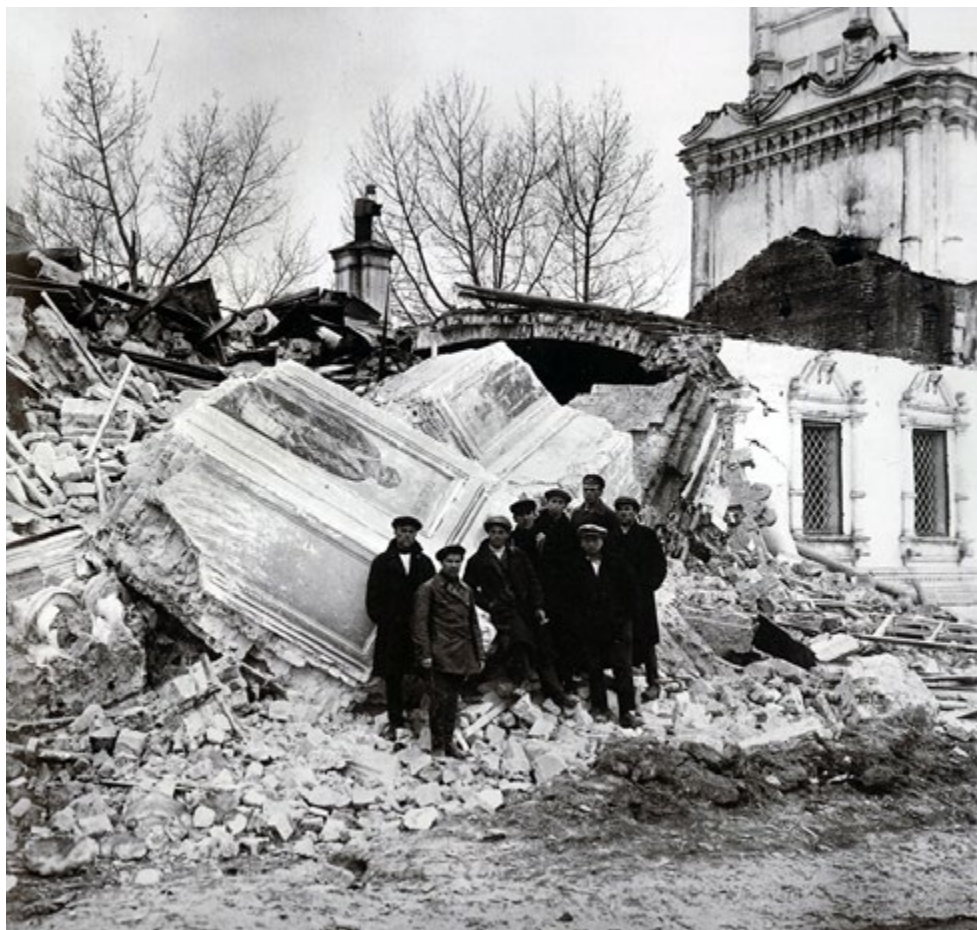
Наиболее жестокой была борьба большевиков с Церковью