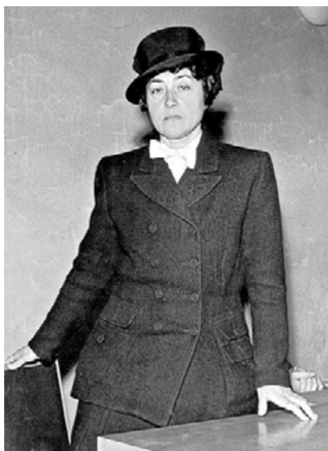
Социалистка Анжелика Балабанова отмечала: «Ленин рассматривал каждое событие с точки зрения революционного стратега»

В воспоминаниях Николая Валентинова (Вольского), в 1904 году разочаровавшегося в большевизме и примкнувшего к лагерю меньшевиков, довольно подробно говорится