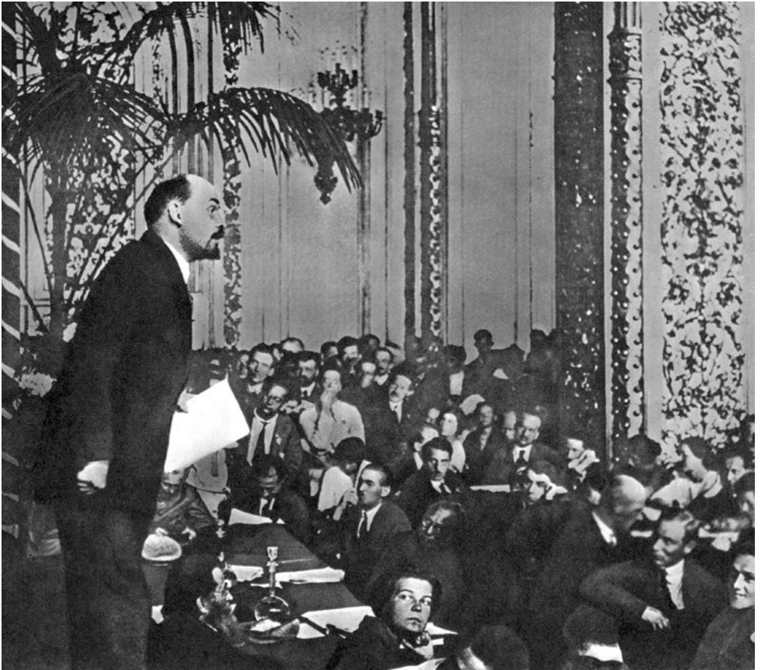
Владимир Ленин был оратором огромного напора и силы. На фото: выступление Ленина на III конгрессе Коминтерна. 1921 год

о событиях первых месяцев того года: «В конце января или в начале февраля Ленин начал писать “Шаг вперед, два шага назад”. В течение трех месяцев, понадобившихся ему для написания книги, с ним произошла разительная перемена: крепко сложенный, полный энергии, жизненно задора, Ленин осунулся, похудел, пожелтел, глаза – живые, хитрые, насмешливые – стали тусклыми, моментами – мертвыми. <...> Он был неузнаваем. Спасаясь от тяжелой депрессии, Ленин убежал отдыхать в какое-нибудь тихое безлюдное место, чтобы выбросить из мозга, хотя бы на время, вошедшую в него как заноза мысль». Такой была его самоотдача.