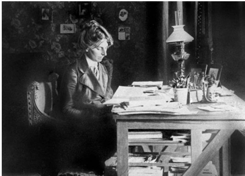
Инесса Арманд. Владимир Ленин писал ей в 1914 году: «Вообще я люблю свою профессию»