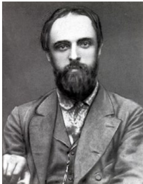
Один из основателей РСДРП Александр Потресов говорил о прямо гипнотическом воздействии Ленина на людей

Его целеустремленность стала темой-рефреном в статье Троцкого «Ленин и старая “Искра”». Человек, много лет враждовавший с вождем большевиков, на сей раз не пожалел восторженных слов: «Этот величайший машинист революции не только в политике, но и в теоретических своих работах, и в занятиях философией, и в изучении иностранных языков, и в беседах с людьми был неизменно одержим одной и той же идеей – целью. Это был самый, может быть, напряженный утилитарист, какого когда-либо выпускала лаборатория истории. Но так как его утилитаризм – широчайшего исторического захвата, то личность от этого не сплющивалась, не оскудевала, а, наоборот, по мере роста жизненного опыта и сферы действия непрерывно развивалась и обогащалась... <...> Нужна была вся могущественная