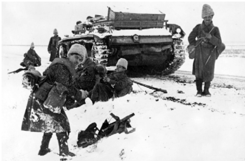
Пехотинцы 4-й румынской армии на дороге под Сталинградом. 1942 год

Таким образом, венгерские, итальянские и румынские части и подразделения, обороняя растянувшиеся на сотни километров фланги германских войск, дали возможность главным силам гитлеровской коалиции на сталинградском направлении – 6-й пехотной армии Паулюса и 4-й танковой армии Гота – сконцентрироваться и нанести мощнейший удар по Сталинграду.