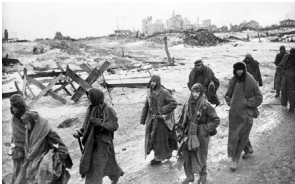
Итальянские и немецкие пленные выходят из Сталинграда после капитуляции. 1943 год

Быстрому разгрому подверглись и венгерские части. Командующий 2-й армией генерал-полковник Яни под угрозой расстрела запретил отступление. Это не подействовало, и вскоре тот же Яни не счел нужным скрывать эмоций в своем приказе: «Бесчестьем является то малодушное, бездумное, трусливое бегство, которое мне пришлось увидеть».