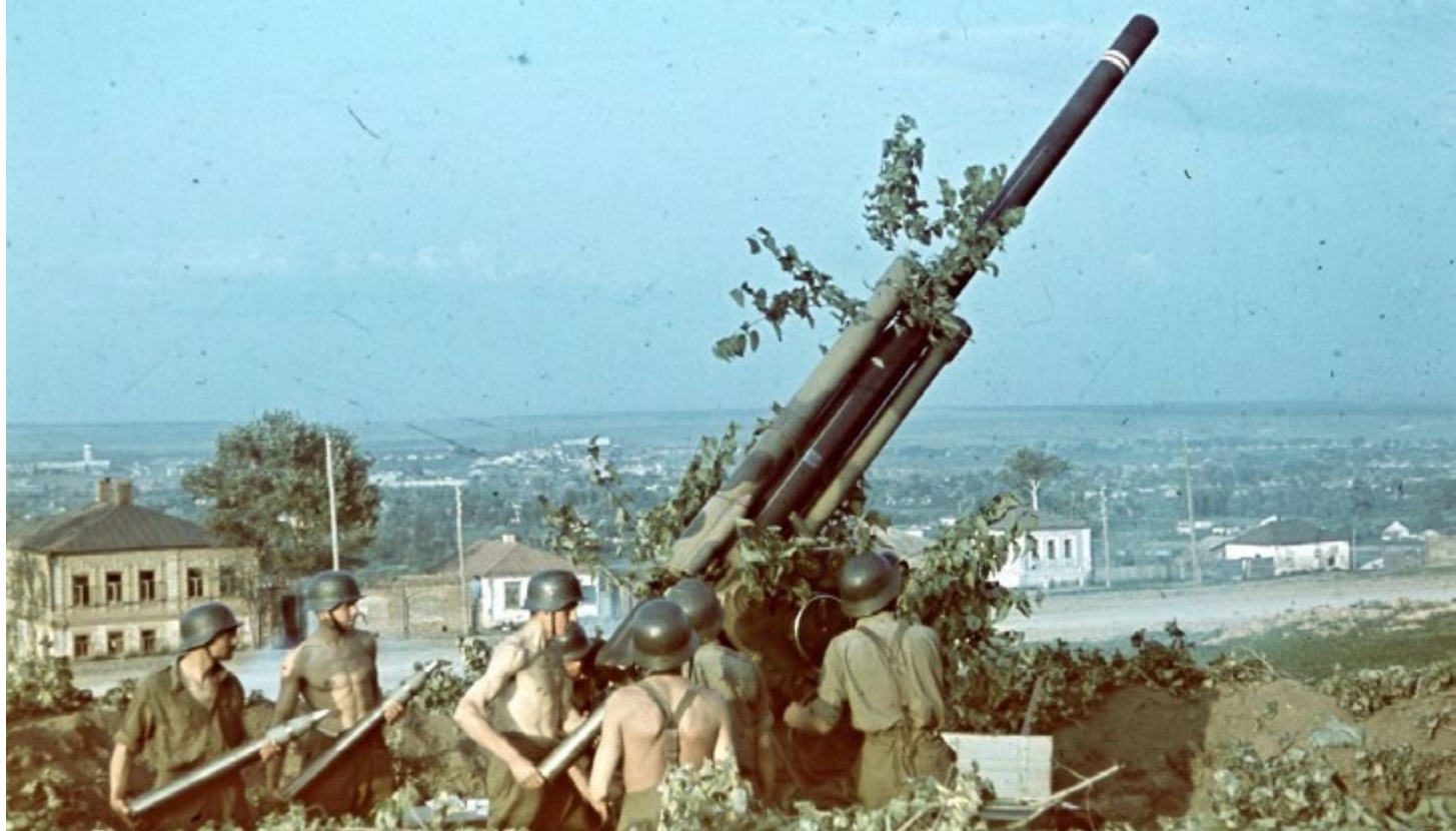
Бойцы 2-й венгерской армии на советском фронте. 1942 год