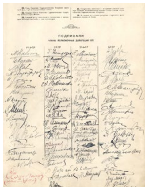
Декларация и Договор об образовании СССР были утверждены I Всесоюзным съездом Советов 30 декабря 1922 года