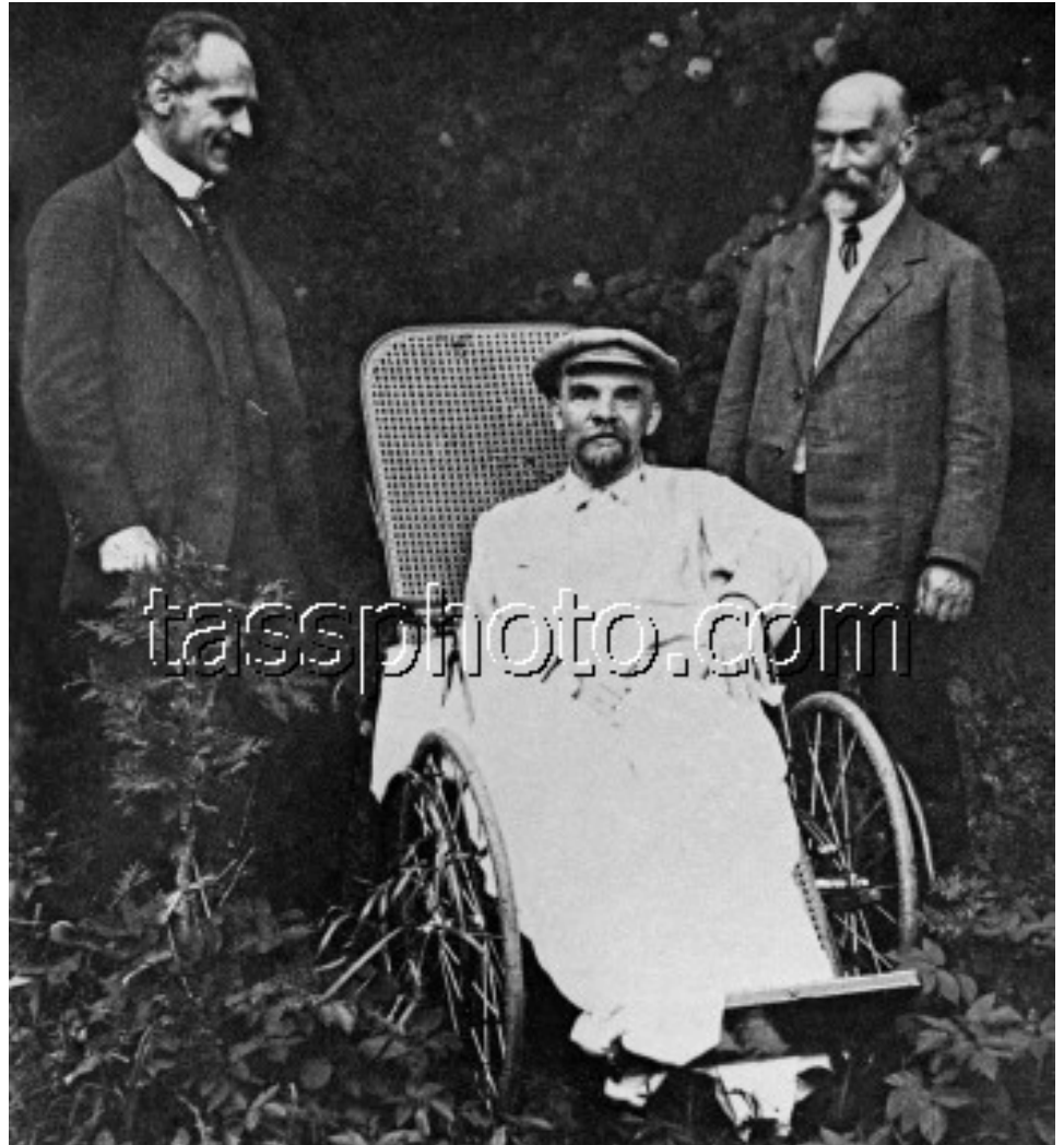
Владимир Ленин (в центре) в Горках. Одна из его последних прижизненных фотографий, лето 1923 года

Положение усугублялось тем, что врачи Ленина раздражали и рассчитывать на то, что он будет неукоснительно выполнять все их предписания, не приходилось. В критической ситуации 18 декабря Пленум ЦК возложил на Сталина «персональную ответственность за изоляцию Владимира Ильича как в отношении личных сношений