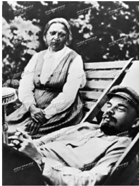
Владимир Ленин и Надежда Крупская в Горках. 1922 год

Вскоре задачу «собрать партию» и «перетряхнуть» партаппарат Ленин возложит лично на товарища Сталина.